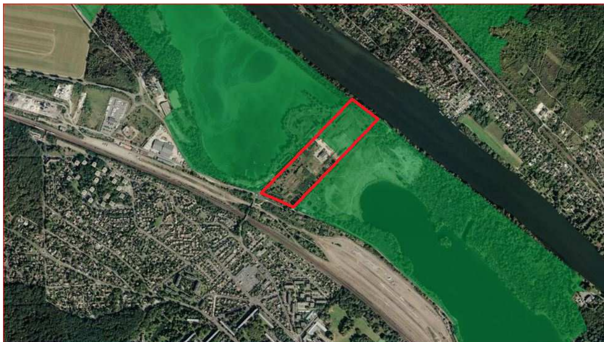
La Pointe de Verneuil (entourée en rouge) au milieu de l'Ile de Loisirs ; en vert, la ZNIEFF de type I sur les étangs

classée en ZNIEFF de type I (Zone Naturelle d'Intérêt Faunistique et Floristique) et en zone N au niveau du Plan Local d'Urbanisme (PLU), c'est-à-dire en zone où il n'est pas possible de construire.