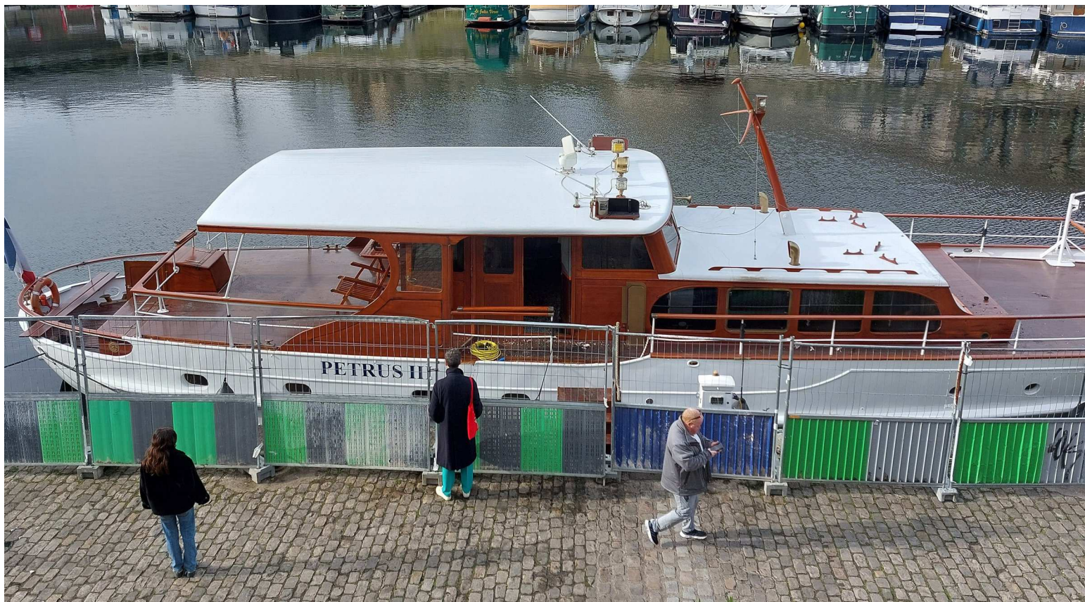
Port de l'Arsenal, quai de la Bastille, Paris (XII e ). Les pompiers ont réussi à maîtriser l'incendie du Petrus III, mais l'intérieur a tout de même été ravagé par les flammes.